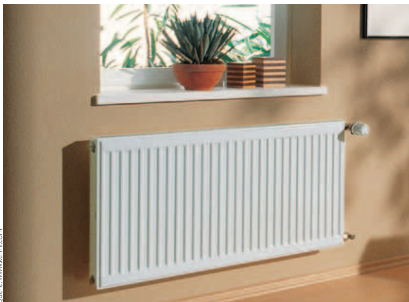
Zweireihiger Plattenheizkörper mit Thermostatventil

Am Markt werden auch elektrisch betriebene Heizkörper angeboten. Sie werden häufig in Wohnungen eingesetzt, um die Installationskosten der Heizanlage gering zu halten. Sie sind nicht zu empfehlen, da Strom die teuerste Energieform ist.